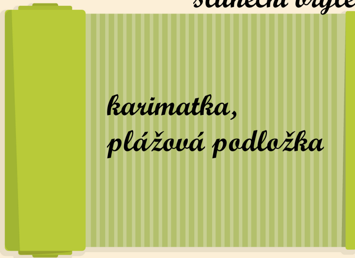
karimatka, plážová podložka